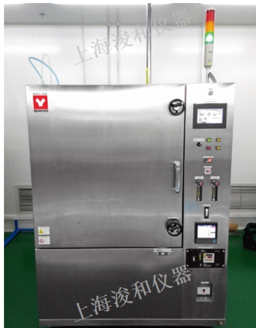
工业烤箱节能省电方法